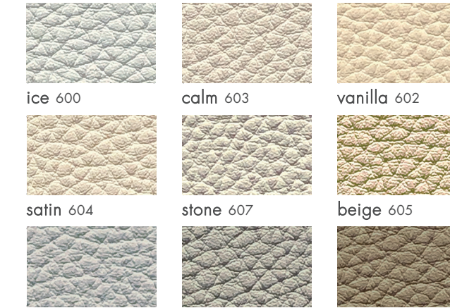
ice 600 calm 603 vanilla 602 satin 604 stone 607 beige 605 silver 601 urban 671 amber 618