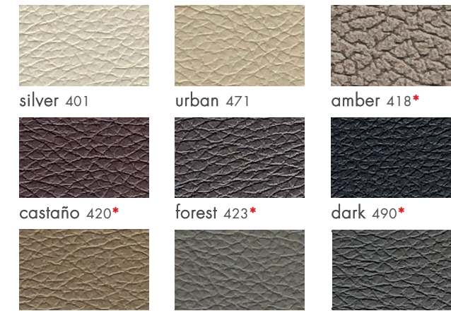
silver 401 urban 471 amber 418* castaño 420* forest 423* dark 490* toffe 419* fossil 470 grey 475*