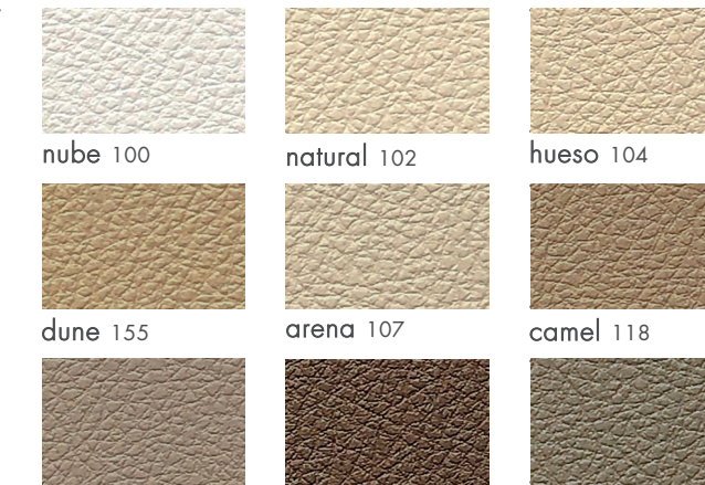
nube 100 natural 102 hueso 104 dune 155 arena 107 camel 118 piedra 198 caqui 192 oliva 145