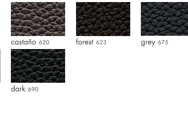
forest 623 grey 675