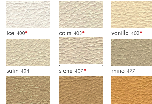
ice 400* calm 403* vanilla 402* satin 404 stone 407* rhino 477 toast 412 terre 411* canela 409