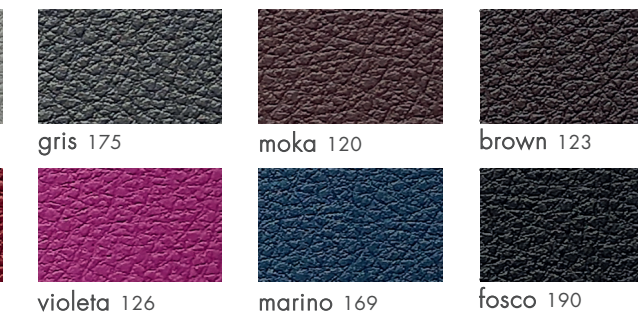
gris 175 moka 120 brown 123 violeta 126 marino 169 fosco 190