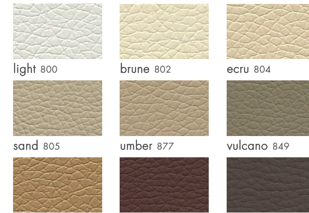
light 800 brune 802 ecru 804 sand 805 umber 877 vulcano 849 capuccino 818 sorrel 824 trufa 820