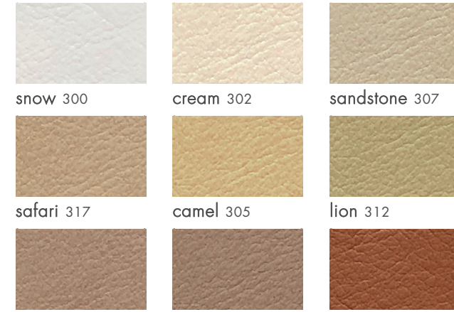
snow 300 cream 302 sandstone 307 safari 317 camel 305 lion 312 coffe 318 chicory 319 chestnut 320