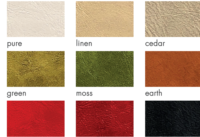
pure linen cedar green moss earth rouge velvet night