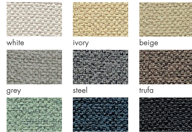
white ivory beige grey steel trufa acuatic navy black